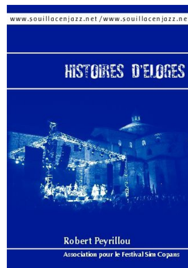
"Histoires d'éloges" de Robert Peyrillou aux éditions Association pour le Festival Sim Copans.

Dossiers de presse musiciens Dossiers de presse festivals : (programmes, flyers, coupures presses) France Régions Étranger